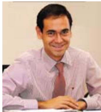
© Ignasi Giménez Renom · Alcalde

A Castellar ja fa set anys que celebrem la Setmana del Pallasso. La primera edició va tenir lloc l'any 2003 amb el propòsit de reivindicar la figura del pallasso. No solament s'ha aconseguit a bastament aquest objectiu, sinó que s'ha convertit en un referent per tot Catalunya gràcies a l'esforç de La Xarxa i tots els seus col·laboradors.