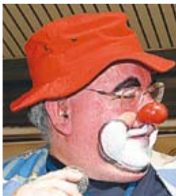
© Gabi Ruiz Bailón · Director

Any rere any ens retrobem amb aquesta manifestació clownesca que és la Setmana del Pallasso, i cada any resulta més difícil abastar les expectatives que es van creant al seu voltant. Això és bo perquè és una demostració de l'evolució positiva i de l'arrelament que aquest festival va assolint. És una mostra de la importància de fer les coses amb il·lusió i creient fermament en allò que es fa.